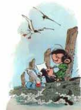
Gaston Lagaffe, par Franquin

Vous pouvez nous joindre aussi par téléphone portable : 918 595 110, et maintenant sur Facebook !